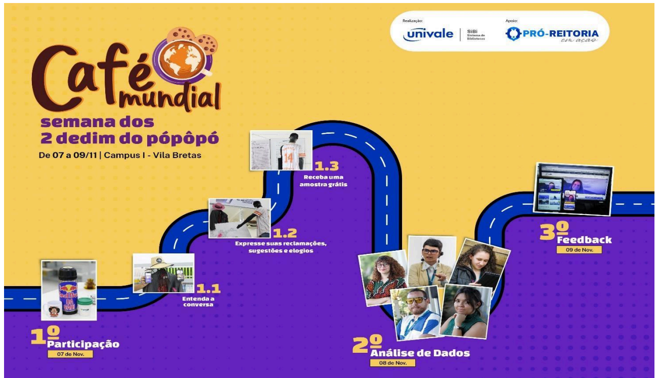
Figura 1 – Etapas do Café Mundial