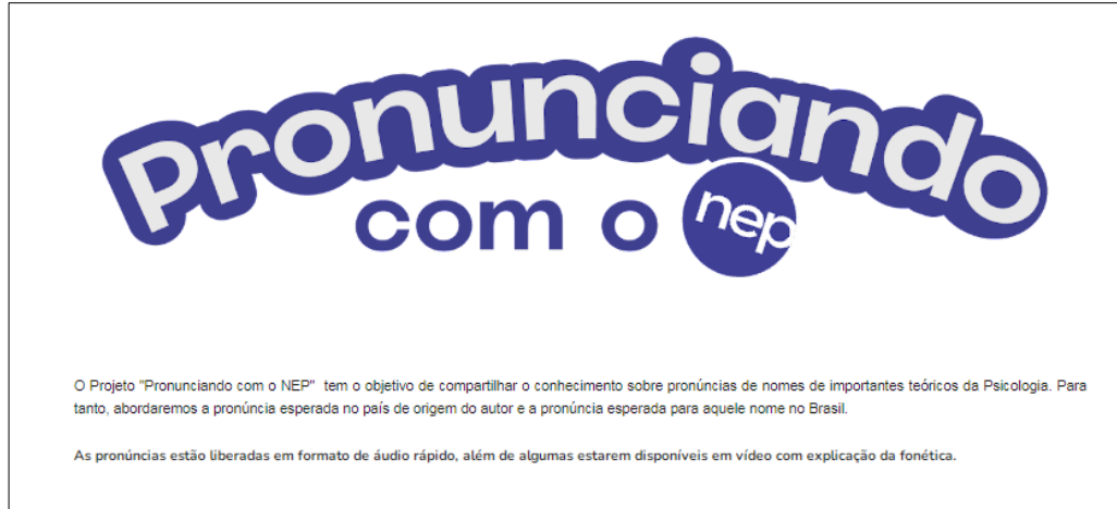
Figura 1 – Mensagem inicial sobre o projeto Pronunciando com o NEP aos visitantes do site